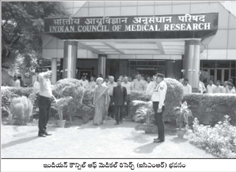
ఇండియన్ కౌన్సిల్ ఆఫ్ మెడికల్ రిసెర్చ్ (ఐసిఎంఆర్) భవనం

“ ఏదేమైనా ఈ ప్రాజెక్టు ప్రధాన లక్ష్యం జీవసంబంధ యుద్ధం అని భావించేందుకు కొన్ని సూచికలు ఉన్నాయి. జిసిఎంయు అధికారికంగా రూపుదిద్దుకోకముందే ఎడెస్ ఈజిప్టి విడుదల కోసం సోనేపట్ ప్రాంతాన్ని డబ్ల్యు హెచ్ వో, యుఎస్ పి హెచ్ ఎస్ లు ఎంపిక చేశాయి. స్థానిక ఇన్స్టిట్యూట్ ఆఫ్ హెల్త్ (ఎన్ఐసిడి) వ్యతిరేకించినప్పటికీ ఆ ప్రాంతాన్ని మార్చలేదు ”