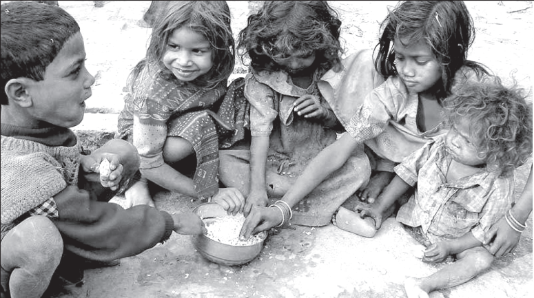
స్వాతంత్ర్యం వచ్చి ఏడు దశాబ్దాలు నిండినా దేశంలో ఇంకా తగ్గని ఆకలి కేకలు

“ పోషకాహార లోపాన్ని తగ్గించటంలో చైనా గణనీయమైన ప్రగతి సాధించింది. చైనా ప్రజల దీర్ఘకాలిక వ్యాధులు, పోషకాహారం నివేదికను 2015లో ప్రచురించారు. దీనిలో చైనా ప్రజలు పోషకాహారం పొందటంలో సాధించిన అభివృద్ధిని, పెద్దలలో పోషకాహార లోపం తగ్గటాన్ని గురించి కూడా పేర్కొన్నారు. 18.5 కిలోల కన్నా తక్కువ బరువున్న వారిలో శారీరక వృద్ధి పెరిగిందని, 6 సం.ల వయసు లోపు పిల్లలలో గిడసబారటం 2002లో 16.3 శాతం నుండి 2013లో 8.1 శాతానికి తగ్గిందని చెప్పారు. ”