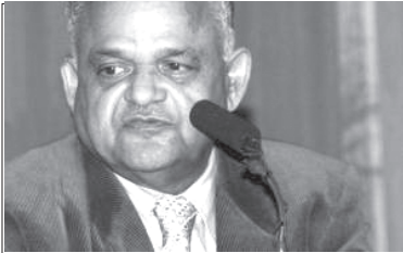
రచయిత పాండిచ్చెరిలోని ఇండియన్ కౌన్సిల్ ఆఫ్ మెడికల్ రీసెర్చ్ విభాగం మాజీ డైరెక్టర్

శాస్త్రవేత్తగా తన ప్రభుత్వ ఉద్యోగానికి రాజీనామా చేసి పిటిఐలో చీఫ్ సైన్స్ రిపోర్టర్ గా చేరారు. 1970 లో స్థాపించిన జిసిఎంయును ప్రపంచ ఆరోగ్య సంస్థ (డబ్ల్యుహెచ్ఎ) దోమల జన్యు నియంత్రణను అధ్యయనం చేయడానికి వినియోగించుకున్న తర్వాత 1975 లో ఎలా మూసివేయాల్సి వచ్చిందనే కథను ఇప్పుడు మరచిపోయారు. ప్రఖ్యాత శాస్త్రవేత్తలు ప్రొఫెసర్ ఎం.ఎన్. స్వామినాథన్, ప్రొఫెసర్ ఎం.జి.కె.మీనన్ కమిటీ 1975 లో అంతర్జాతీయ శాస్త్రీయ సహకారంపై జారీ చేసిన మార్గదర్శకాలను కూడా మర్చిపోయారు. ఈ రోజు 91 ఏళ్ల వయసులో, క్షీణిస్తున్న జ్ఞాపకాలతో జిసిఎంయు శాస్త్రవేత్తగా ఏమి జరిగిందో నేను గుర్తుచేస్తాను. పిఎల్ 480 నిధులతో (యు.ఎస్. విదేశీ సహాయ పంపిణీ కోసం ఏర్పాటు చేసిన పబ్లిక్ లా 480 నిధులు) జిసిఎంయు ప్రాజెక్ట్ ను పూర్తిగా ప్రపంచ ఆరోగ్య సంస్థ నిర్వహించింది. డబ్ల్యు హెచ్ ఒక ఐసిఎంఆర్ కు మధ్య సహకార ఒప్పందం ఉన్నది. ఈ సహకారం పూర్తి ఏకపక్షంగా కొనసాగింది. డబ్ల్యు హెచ్ ఒక తన ప్రతినిధి (డాక్టర్ ఆర్. పాల్) ద్వారా ప్రాజెక్ట్ కు చెందిన అన్ని అంశాలను పర్యవేక్షించింది. ఐసిఎంఆర్ తాను నియమించిన భారతీయ సిబ్బందికి జీతాలను మాత్రమే చెల్లించింది. డబ్ల్యుహెచ్ ఒక కు, అమెరికాకు చెందిన యునైటెడ్ స్టేట్స్ పబ్లిక్ హెల్త్ సర్వీస్ (యుఎస్ పిహెచ్ఎస్) మధ్య ప్రత్యేక ఒప్పందం ఉంది. ఇది ఐసిఎంఆర్ కు మాత్రమే కాక భారత ఆరోగ్య మంత్రిత్వ శాఖకు కూడా తెలియదు! యుఎస్ పబ్లిక్ హెల్త్ సర్వీస్ అన్ని విధాన నిర్ణయాలు తీసుకునేది. యు.ఎస్. జీవాయుధ యుద్ధ విభాగం ప్రధాన కార్యాలయ ప్రతినిధి ఫోర్ట్ డెట్రీక్ శాస్త్ర, సాంకేతిక అంశాలకు చెందిన సమావేశాలకు హాజరయ్యేవారు. ఐసిఎంఆర్ తో