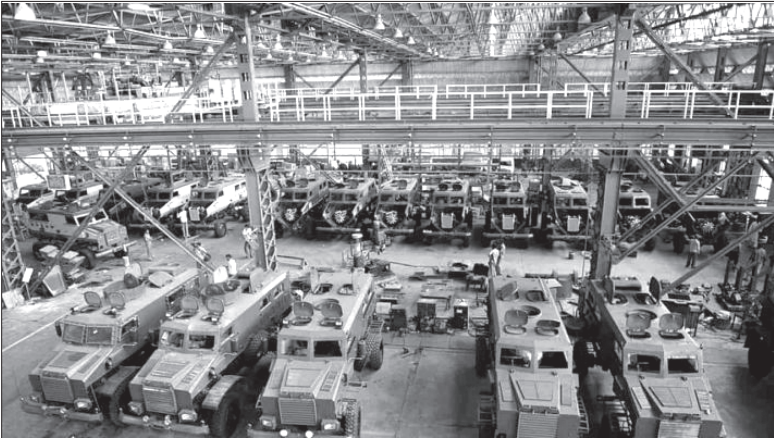
కేంద్ర ప్రభుత్వం ప్రయోజనీకరించబోతున్న 8 సైనిక టేన్ వర్కషాపుల్లో ఒకటి

“ రాజకీయ పార్టీలు నిర్దిష్ట పరిస్థితిని బట్టి రూపొందించు కునే కార్యాచరణలతో నడుస్తాయి. నిలుస్తాయి. ఇక్కడే రాజకీయ వ్యూహాలను యుద్ధరంగంతో పోల్చవచ్చు. యుద్ధం లో పాల్గొంటున్నా ఎప్పుడు ఎలాటి అడుగు వేయాల్సింది రణ భూమిలోనే నిర్ణయమవుతుంది తప్ప సైనికశాస్త్రం చెప్పిందని శాశ్వత నిర్ణయాలు జరగవు. ఇది రాజకీయ వ్యూహాలకూ వర్తిస్తుంది. ”