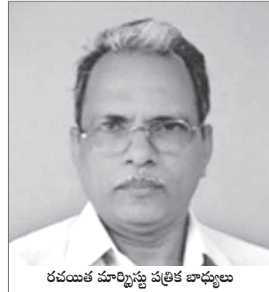
రమయత మార్పిణ్ణి పత్రిక బాధ్యులు

వికృతాజ్యనమితికి చెందిన ఆహార, వ్యవసాయ సంస్థ-ఎఫ్ఎఐ- “ ప్రపంచంలో ఆహారభద్రత, పోషకాహార లభ్యత” అన్న అంశాలపై 2020 సంవత్సరం నివేదికను విడుదల చేసింది. ఆహార అభద్రత, ఆకలి, వివిధ రకాలైన పోషకాహార లోపాలను అధిగమించాలని ప్రపంచదేశాలు నిర్ణయించు కున్న గడువు ముగిసిన ఐదు సంవత్సరాల తర్వాత కూడా మనం 2030లో ఆ లక్ష్యాన్ని సాధించటానికి సగం దూరంలో ఉంటామని నివేదికలో పేర్కొన్నారు. ప్రపంచం స్థిరమైన అభివృద్ధి లక్ష్యాలలో చెప్పిన విధంగా సురక్షితమైన, పోషకాలతో కూడిన ఆహారాన్ని అందించటం లేదా అన్ని విధాలైన పోషకాహార లోపాలను నిరోధించేవైపుకు గానీ సాగిపోవటం లేదు. ఆర్థికాభివృద్ధి మందగించటం ఈ ప్రయత్నాలపై ప్రభావం చూపిందని 2019లో రూపొందించిన నివేదిక వెల్లడించింది. 2020లో కోవిడ్ మహమ్మారి సంభవించటం, తూర్పు ఆఫ్రికాలో మిడతల దండు సృష్టించిన విధ్వంసం ఎవరూ ఊహించనివి. ఇవి పరిస్థితిని మరింత దిగజార్చాయని స్పష్టం చేసింది.