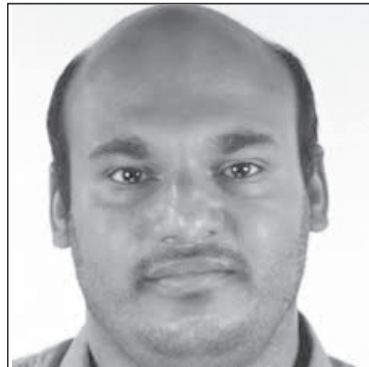
రచయిత కొలంబియాలోని ఇటెసి యూనివర్సిటీలో ప్రొఫెసర్

బొలీవియాలో అక్రమంగా అధికారం హస్తగతం చేసుకున్న మితవాద శక్తులపై కార్మికులు, రైతుల ఆధ్వర్యంలోని సామాజిక ఉద్యమ సంస్థలు సంఘటితమై జరిపిన అప్రతిహత పోరాటాలతో వామ పక్షాలు తిరిగి అధికారంలోకి రావడం సాధ్యపడింది. ఎన్నికలలో విజయం సాధించిన ఇవో మొరెల్స్ 2019 నవంబర్ 12న వైమానిక దళ జెట్లో మెక్సికోకు ప్రవాసం వెళ్లారు. ఎన్నికలలో మోసం జరిగిందని తప్పుడు ఆరోపణలతో కొన్ని శక్తులు నిరసనలకు పూనుకున్న తరువాత రాజీనామా చేయాలని సాయుధ దళాల చీఫ్ “వత్తిడి చేసినపుడు” ఆయన పదవీ విరమణ చేశాడు. దాదాపు ఒక సంవత్సరం తరువాత, ఆరెంటీనా అధ్యక్షుడు అల్బెర్టో ఫెర్నాండెజ్తో కలిసి రోడ్డుమార్గం ద్వారా ఆయన బొలీవియాకు తిరిగి వచ్చాడు. అక్కడ నుండి మూడు రోజుల పాటు 800 వాహనాల కారవాన్తో అతను పుట్టి పెరిగిన గ్రామీణ ప్రాంతమైన ఒరినోకాతో సహా దేశంలోని వివిధ ప్రాంతాల్లో పర్యటించారు. మొరెల్స్ కోకా రైతుల నాయకునిగా రాజకీయ ప్రస్థానం ఆరంభించిన చాపారెకు వెళ్ళాడు. ఎన్నికలలో భారీ విజయం సాధించిన తరువాత సోషలిస్టు ఉద్యమ పార్టీ ఎంఎఎస్ అభ్యర్థి, మొరెల్స్ ప్రభుత్వంలో ఆర్థికశాఖ మంత్రిగా పనిచేసిన లూయిస్ ఆర్స్ కాటాకోరా అంతకు ఒక రోజు ముందు దేశ క్రాంతి అధ్యక్షుడిగా ప్రమాణ స్వీకారం చేశారు. బొలీవియాలో గత యేడాది ఏమి జరిగిందో వాటి నుంచి నేర్చుకున్న అతి ముఖ్యమైన పాఠాలు, తలెత్తిన అనేక ప్రశ్నలు మన కళ్ల ముందు ప్రతిబింబిస్తూనే ఉన్నాయి. జూన్ 2020లో ఎకనామిక్ అండ్ పొలిటికల్ వీక్లీలో ప్రచురించిన ఒక కథనంలో 2019 నవంబర్లో బొలీవియాలో జరిగిన తిరుగుబాటు గురించి చర్చించాను. అందులో మొరెల్స్ ను పదవీచ్యుతుని చేయడం, దేశంలోని తీవ్ర