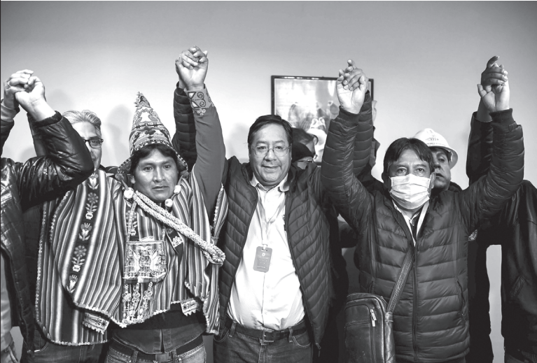
బొలీవియా నూతన అధ్యక్షుడు లూయిస్ ఆర్సె (మధ్యలో ఉన్న వ్యక్తి)

“2020 ఆగస్టులో ఎన్నికలు మూడవసారి వాయిదా వేసినప్పుడు కార్మికసంఘాల సమాఖ్యతో సహా సామాజిక ఉద్యమ సంస్థలు, స్వదేశీ రైతు సంస్థలు నిరవధిక సమ్మెను ప్రకటించాయి. మొదటి రోజు దేశం అంతటా 75 వ్యూహాత్మక కేంద్రాలను దిగ్బంధించారు. తరువాత కొద్దిరోజులలో దిగ్బంధించిన కేంద్రాల సంఖ్య 128 కి పెరిగింది. క్రమంగా నిరసనకారులు ఎన్నికలను వాయిదా వేయకూడదనే ప్రారంభ డిమాండ్ కు తోడు, అనీజ్ వెంటనే రాజీనామా చేయాలనే డిమాండ్ కు కూడా ముందుకుతెచ్చారు.”