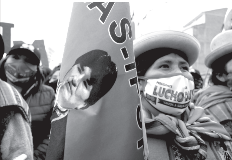
బొలివియా ఎన్నికల్లో ఈవో మోరేల్స్ ఫోటోలతో మూవ్ మెంట్ ఫర్ సోషలిజం పార్టీ ప్రచారం

“కేబినెట్ లో సంస్కృతి, విద్య, గ్రామీణాభివృద్ధి వంటి మంత్రిత్వ శాఖలకు వలసల నివారణ, సామాజిక సమానత్వం వంటి ఉప మంత్రిత్వ శాఖలకు స్వదేశీ ప్రాతినిధ్యాన్ని పరిమితం చేశారు. ఇది జాతి కోణాన్ని కలిగి ఉంది. విదేశీ వ్యవహారాలను మినహాయించి వ్యూహాత్మకంగా చాలా ముఖ్యమైన మంత్రి పదవులను సాంకేతిక నిపుణులు లేదా స్థానికేతర వామపక్ష మేధావులు ఆక్రమించారు. దీనిపై రాడికల్ బృందాల మేధావులు అసంతృప్తి వ్యక్తం చేశారు. ”