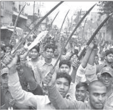
హిందూత్వ సంస్థలు ముస్లిం వ్యతిరేక ప్రచారాన్ని ఒక వ్యూహం ప్రకారం చేస్తాయి.

పెట్టేవారికి శాపాలుగా పరిణమిస్తాయి. సావార్కర్ తన రచనలలో హిందూత్వ గురించి ఈ విధంగా చెబుతారు: “మనలోనూ మన శత్రువులలోనూ రామ్మడిగా వున్న అంశాలు వారిని వ్యతిరేకించటంలో మనల్ని బలహీనులుగా చేస్తాయి. మనతో ఒక్క అంశంలో కూడా సారూప్యత లేని శత్రువును దృఢంగా ఎదుర్కోగలం”. అందువల్లనే హిందూత్వ శక్తులు ఇతర మతాలవారిని వేరుగా ముద్రవేస్తారు. హింసాకాండ ద్వారా సాధారణాంశాలను వ్యతిరేకిస్తారు. చాలా సాధారణమైన వ్యత్యాసాల్ని, చివరికి వంటలోనూ, తిండిలోనూ గాండే వ్యత్యాసాలను కూడా పెద్దవిచేసి ముఖ్యమైనవాటిగా చూపి, హింసాకాండ ద్వారా ప్రచారం కల్పిస్తారు. హింస, అబద్ధ ప్రచారం, వ్యత్యాసాల్ని అతి ముఖ్యమైన వాటిగా చూసిస్తారు. అనుమానితులుగా ముద్రవేయటం తదితరాలు కొద్ది సంవత్సరాల క్రితం కన్నా ఇప్పుడు పెరిగింది. ముస్లింలు, క్రైస్తవులు మనకు భిన్నంగా గానూరనే ప్రచారానికి విస్తృత ప్రచారం లభిస్తుంది. ఈ అభిప్రాయం మిగతా ప్రాంతాలకన్నా మత ఘర్షణలు జరిగిన ప్రాంతాల్లో ఎక్కువగా గాంది. ముజఫర్ నగర్ ఇందుకు తాజా సాదాహరణ. 2013 సెప్టెంబర్ లో మత ఘర్షణలు జరిగే వరకు జాట్లు, ముస్లింలు సామాజికాంశాల్లో ఒకే విధమైన మాటతీరు, పెళ్ళిళ్లు నీతి నియమాలకు, గోత్రాలకు సంబంధించి ఒకేవిధంగా వ్యవహరించేవారు. ఒకే తేడా ఏమిటంటే వేర్వేరు ప్రార్థనా స్థలాలకు వెళ్ళేవారు. మత ఘర్షణల తర్వాత మేము ముజఫర్ నగర్ వెళ్ళినప్పుడు ‘వారు’, ‘మేము’ అనే పదాలను సాధారణంగానే వాడుతున్నారు. ప్రతి మత ఘర్షణ నివాసప్రాంతాలు మతపరంగా విడివడటానికి దారితీస్తున్నది. 1993 మత ఘర్షణల తర్వాత బొంబాయిలో ఈ విభజన తీవ్రమైన తర్వాత ముస్లింలు కొన్ని ప్రాంతాల్లో కేంద్రీకృతం చేయబడ్డారు. 1992-93 మత ఘర్షణల తర్వాత ముంబైలోని మీరా రోడ్డులో