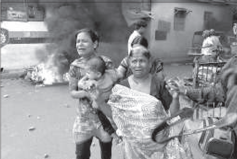
ఆర్ఎస్ఎస్ విద్వేష ప్రచారానికి బలయ్యేది పేదప్రజలే