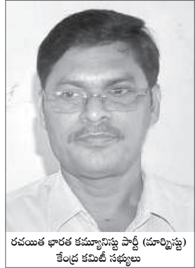
రచయిత భారత కమ్యూనిస్టు పార్టీ (మార్క్సిస్టు) కేంద్ర కమిటీ సభ్యులు

కమ్యూనిస్టు పార్టీలో నిర్ణయాలన్నీ కేంద్ర నాయకులే చేస్తారన్న ప్రచారం ఉన్నది. నిజమా? పార్టీ పునాది ఎందుకు బలహీనపడిందని సభ్యులు, కొందరు కార్యకర్తలు కూడా ప్రశ్నిస్తారు. కారణమేమిటి? మహాసభల సందర్భంగా ఇలాంటి ప్రశ్నలు అనేకం వస్తుంటాయి.