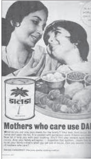
దాదా వాణిజ్య ప్రకటన: మాతృ ప్రేమను కూడా వస్తువులతో కొలవాల్సిందే.

మీడియాలో 'జెండర్' విభజన ధోరణులలో దాగి ఉన్న మరో కోణం హిందూ జాతీయతా వాదం. ప్రత్యేకించి వాణిజ్య ప్రకటనలో ఇది ప్రస్తుతంగా కనిపిస్తుంది. కులము, మతము, వర్గం - వీటికి అతీతంగా 'జెండర్'ను తటస్థ రూపంలో చూపిస్తున్నట్లు కనబడినా నిజానికి ఇది భారతదేశంలో ఉన్న వైవిధ్యతను, భిన్న జాతుల కులాల, మతాల సమాహారమున్న వాస్తవాన్ని కప్పిపెట్టడానికి చేసే ప్రయత్నమే. 'డోప్' సబ్బును ఏ ముస్లిం మహిళో, ఏ దళిత - గిరిజన మహిళో వాడుతున్నట్లు చూపిస్తున్నారా? లేదు, అందుకు కారణం వీరు 'భవిష్య వినియోగదారి సమూహం' కిందకి రారు అనేదేనా? కానేకాదు. హిందూ జాతీయ వాదాన్ని బలంగా ప్రతిష్ఠించే క్రమంలో 'అవాంఛిత' కులాల, మతాలకు చెందిన వారిని 'అసుంటా' పెట్టే కార్యక్రమమే ఇది. 'హిందూ సాంస్కృతిక ఆర్థికవ్యవస్థలో వీళ్ళంతా కడగట్టున ఉండాల్సి వాళ్ళు, అందుకే ఓ పథకం ప్రకారం మీడియాలో మనకు 'హిందూత్వ' ప్రతిరూపాల్నే చూపిస్తున్నారు. అక్కడా ఇక్కడా పొరబాటున 'చేరే' వాళ్ళని చూపించాల్సి వచ్చినా వాళ్ళను మట్టి బుర్రలు గానో, చతుర్ధాదేందుకు పనికొచ్చే పాత్రలుగానో చూపిస్తారు. క్వాలిటీ ఐస్క్రీంలో చూపించే 'క్రెస్ట్' మనకు ఇందుకు ఒక ఉదాహరణ.