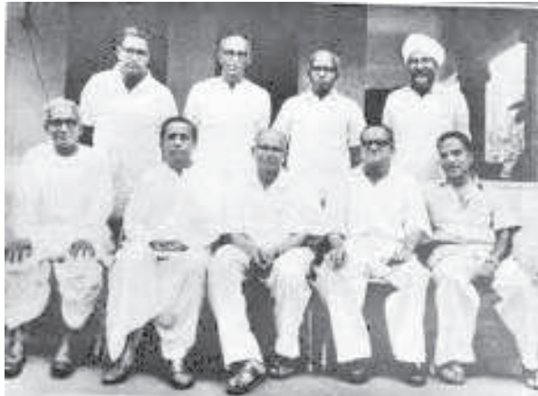
భారత కమ్యూనిస్టు రాజ్యమాన్ని రివిజనిజం నుండి కాపాడడంలో కీలక పాత్ర నిర్వహించిన నవరత్నాలు. డా. పొలిట్ బ్యూరో సభ్యులు

“కార్మిక- కర్షక మైత్రి” : భారతదేశంలో విప్లవం సాధనలో మౌలిక అంశం. ఈ వ్యూహాత్మక లక్ష్యాన్ని ముందుకు తీసుకెళ్లే క్రమంలో కార్మిక కర్షక మైత్రిని బలోపేతం చేయటంలో ఉంది. ప్రస్తుత పరిస్థితుల్లో వర్గ పోరాటాలను బలోపేతం చేయాలంటే కార్మిక కర్షక మైత్రి సాధనలో ఉన్న బలహీనతలను అధిగమించాల్సి ఉంది. ఈ కర్తవ్యాన్ని నెరవేర్చటానికి భారత దేశంలో భౌతిక పరిస్థితులు అనుకూలంగా ఉన్నాయి. 99