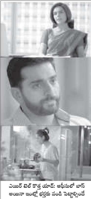
ఎయిర్ టెల్ కొత్త యాడ్: ఆఫీసులో బాస్ అయినా ఇంట్లో భర్తకు పండి పెట్టాల్సిందే

“ వాణిజ్య ప్రకటనల రంగంలో 80 దశకంలోనే 'సర్ప్' కంపెనీ ప్రకటనలో 'లలితగారు' చురుకైన, తెలివైన గృహిణికి ప్రతిరూపంగా బుల్లితెరను ఓ ఊపు ఊపేసింది. మార్కెట్లోకి సరుకులు వెల్లువలా వచ్చి పడిపోతుంటే ఏది మంచి, ఏది చెడో ఇట్టే పసికట్టే తెలివైన మధ్యతరగతి గృహిణిగా చాలా కాలంపాటు అందరి మనస్సులో నిలిచిపోయిన ప్రకటన అది. 'చౌకగా' వస్తువులు, సరుకులు కొనాలకునే సగటు మనస్తత్వం మీద ఈ ప్రకటన పెద్ద యుద్ధమే చేసింది. ”