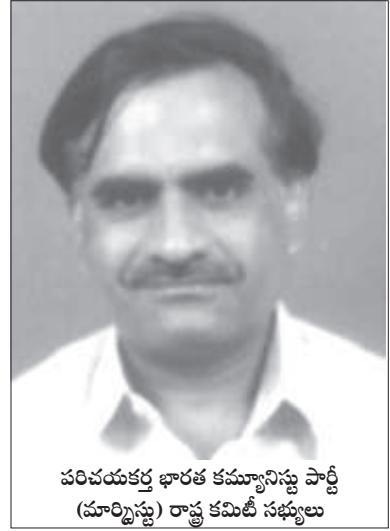
పరిచయకర్త భారత కమ్యూనిస్టు పార్టీ (మార్క్సిస్టు) రాష్ట్ర కమిటీ సభ్యులు