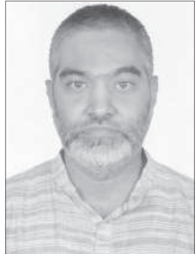
రచయిత 'సెంటర్ ఫర్ స్టడీ ఆఫ్ సాసైటీ అండ్ సెక్యులరిజం' సంస్థ డైరెక్టర్. తౌకికతత్వం మీదా, సామాజికాంశాలమీదా అనేక పుస్తకాలు, వ్యాసాలు రాశారు.

ఆర్ఎస్ఎస్-హిందూత్వ సంస్థలు అసలు చర్చనీయాంశమే కాని అంశాలను తీసుకొని, కొన్ని మతాలను విదేశీయులని ముద్రవేసి, వారిని అపఖ్యాతిపాలు చేసేలా వ్యవహరిస్తున్నాయి. హిందూత్వ గురించి వి.డి. సావార్కర్ రాసిన కరపత్రంలో ఈ విధంగా పేర్కొన్నారు: 'ఱమ్మడి శత్రువుపై ద్వేషం ప్రజలను జాతులు గానూ, జాతులను రాజ్యాలుగానూ ఐక్యం చేస్తుంది. ద్వేషం ప్రజలను విడదీస్తుంది... ఐక్యం చేస్తుంది'. సావార్కర్ దృష్టిలో ఱమ్మడి శత్రువులంటే తమ పవిత్ర భూమి అయిన హిందుస్తాన్లో అంటే సింధునది, అరేబియన్ సముద్రం మధ్యభాగంలో లేనటువంటి ముస్లింలు, క్రైస్టియన్లన్నమాట. ఆనాటి నుండి హిందూత్వ సంస్థలు వాస్తవిక శత్రువునుకాక ఊహాజనిత శత్రువునూ, చారిత్రక శత్రువును కాక కట్టుకథల ద్వారా ఱమ్మడి శత్రువునూ రూపొందించటానికి తమ శక్తియుక్తులను వెచ్చిస్తున్నారు. మొదటగా వాళ్ళు ప్రత్యేకంగా ముస్లింలపైనే కేంద్రీకరించారు. 1998లో బిజెపీ నాయకత్వంలోని ఎన్డీఎ అధికారంలోకి వచ్చిన తర్వాత తమ బహిరంగసభలలో హిందువులను క్రైస్తవ మతంలోకి మార్చటానికి ప్రయత్నిస్తున్నారంటూ క్రైస్తవులను కూడా ఱమ్మడి శత్రువుగా చూపటం ప్రారంభించారు.