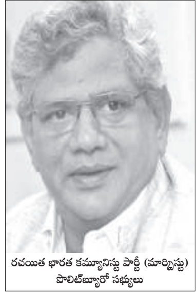
రచయిత భారత కమ్యూనిస్టు పార్టీ (మార్క్సిస్టు) పాలిట్ బ్యూరో సభ్యులు