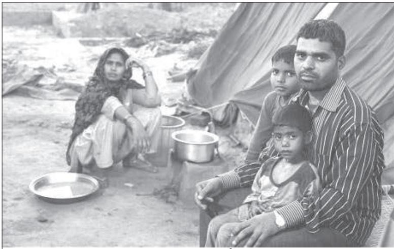
ముజఫర్ పూర్ అల్లర్లకు నిర్వాసితులైన పేద ముస్లిం కుటుంబం