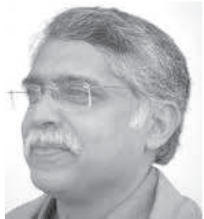
రచయిత న్యూఢిల్లీలోని సెంటర్ ఫర్ ఎకనామిక్ స్టడీస్ అండ్ ప్లానింగ్ ప్రొఫెసర్. ఆర్థిక వ్యవహారాలపై విస్తృతంగా రాస్తారు