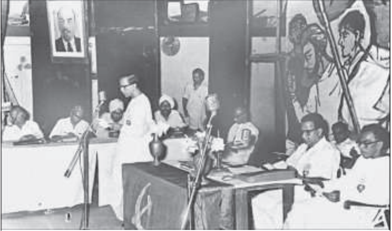
1964లో కలకత్తాలో జరిగిన సిపిఐ(ఎం) ఆవిర్భావ సభలో ప్రసంగిస్తున్న జ్యోతిబసు. వేదికపై వెకె గోపాలన్, మాకినేని బసవపున్నయ్య, హరికిషన్ సింగ్ సూరిత్, ఇఎంఎస్ నంబూద్రిపాద్ ప్రభృతులు

66 ఈ కాలంలో పార్టీ పార్లమెంటరీ రాజకీయాల్లో ఎదుర్కొన్న వైఫల్యాల నేపథ్యంలో పార్టీపై బూర్జువా పత్రికల్లో, ప్రసార సాధనాల్లో జరుగుతున్న దాడులకు సమాధానం చెప్పాల్సిన అవసరం కూడా ఉంది. యాభై ఏళ్ల నాడు, 1964, ఏప్రిల్ 11న 32 మంది కమ్యూనిస్టు యోధులు పార్టీ జాతీయ కౌన్సిల్ సమావేశాల నుండి వాకౌట్ చేసిన సందర్భాన్ని పురస్కరించుకుని జరుపుకుంటున్న ఉత్సవాల్లో ఈ ప్రశ్నలకు కూడా సమాధానం చెప్పటం ఆ యోధులకు మనం అర్పించే నివాళి. 99