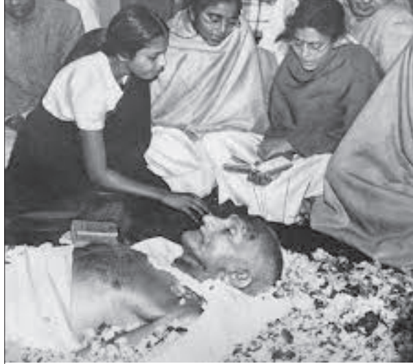
ఆర్ఎస్ఎస్ అనుయాయి ఘాట్స్ చేత హత్యగావించబడిన గాంధీజీ

ముస్లింలీగ్ నాయకుల్లో చాలా మందికి బాహాటంగా కాకపోయినా, లోపల్లోపల కాంగ్రెస్ ఉద్యమం హిందూ మెజారిటీ ఆధ్వర్యంలో నడిచే ఉద్యమం అన్న అనుమానం ఉండేది. హిందువులు, ముస్లింలు వేర్వేరు విలువలను పాటిస్తారనీ, వేర్వేరు దేవతలను ఆరాధిస్తారనీ, వేరువేరు ఆహారాలను తింటారనీ, వేరువేరు పద్ధతుల్లో పరస్పర సంబంధాలను నెలకొల్పకుంటారనీ జిన్నా వాదించేవాడు. కాని వాస్తవంగా చూస్తే