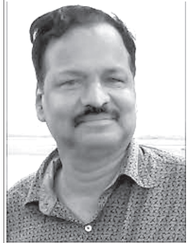
రచయిత ఒడిషా యూనివర్సిటీ మాజీ వైస్ ఛాన్సలర్

మన సమాజం సాంస్కృతికంగా వైవిధ్య భరితమైన సమాజమని, సాంస్కృతిక పరంగా దేశంలో “అంతా బాగుంది” అని సమాజాలు, వ్యక్తులు సాధారణంగా అనుకోవడం కద్దు. అయితే ఈ సాధారణ అవగాహనకు మించి తెలుసుకోవాలంటే ఉద్యమాలు, అందులో దాగి ఉన్న తాత్విక చింతనను గురించి పరిశోధించాల్సిన అవసరం ఉంది. భవిష్యత్తు పరిశోధనపైనే వైవిధ్య భరిత సంస్కృతిలో అందరూ భాగస్వాములు కావటం ఆధారపడి ఉంటుంది.