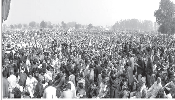
మోడీ మెడలు పంచిన రైతు ఉద్యమం

భారతదేశంలో హిందూ జాతీయవాదం ప్రాధాన్యత చాలాకాలం ఉంటుంది. ఒక రాజకీయపరమైన భావనగానే గాక సాంస్కృతిక విలువల పరంగా కూడా దాని ప్రభావం ఉంటుంది. వాళ్ళు పాఠశాలల్లో సిలబస్ను, బోధనాంశాలను మార్చేశారు. కీలకమైన అధికార స్థానాల్లో వారి మనుషుల్ని కూచోబెట్టారు. అధికార యంత్రాంగంలో సైతం ఉన్నారు. దాని ప్రభావం దీర్ఘకాలంపాటు