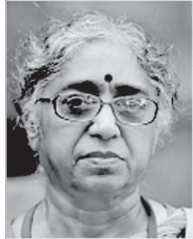
రచయిత సిఐటియు ఆఫీలభారత అధ్యక్షులు

2021 నవంబరు 11న ఢిల్లీలో జాతీయ కార్మిక సదస్సు జరిగింది. కేంద్ర కార్మికసంఘాల ఉమ్మడి వేదిక, అఖిల భారత స్థాయి స్వతంత్ర ఫెడరేషన్లు అన్నీ కలసి ఈ సదస్సును నిర్వహించాయి. 2022 పార్లమెంట్ బడ్జెట్ సమావేశాల సందర్భంగా ఫిబ్రవరి 23-24 తేదీలలో రెండు రోజుల పాటు సార్వత్రిక సమ్మె జరపాలని తొలుత సదస్సు పిలుపునిచ్చింది. అయితే దేశంలో కరోనా మూడో వెల్లువ, అయిదు రాష్ట్రాల్లో ఎన్నికలను దృష్టిలో పెట్టుకుని సమ్మెను మార్చి 28,29 తేదీలకు వాయిదా వేసింది. ప్రజలను కాపాడండి, దేశాన్ని కాపాడండి' అనే నినాదంతో సమ్మె జరుగనున్నది.