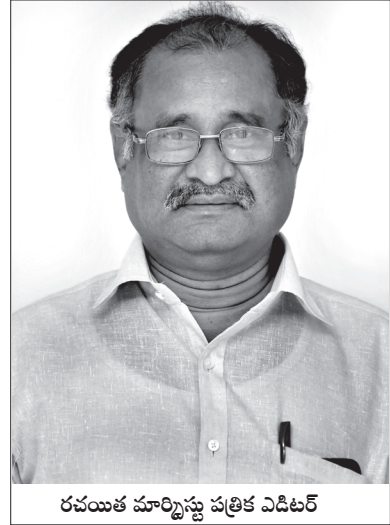
రచయిత మార్కిస్టు పత్రిక ఎడిటర్

సామ్రాజ్యవాదుల విస్తరణవాదం ప్రపంచాన్ని నిరంతరం యుద్ధాల్లోనూ, యుద్ధ భయంలోనూ ఉంచుతోంది. రెండవ ప్రపంచ యుద్ధం వరకు సామ్రాజ్యవాదులు తమలో తాము కొట్లాడుకుంటూ కోట్లమంది ప్రాణాలు తీశారు. రెండవ ప్రపంచ యుద్ధం తరువాత కమ్యూనిజం నుండి రక్షణ పేరుతో అమెరికా నేతృత్వంలో నాటో కూటమిని ఏర్పాటు చేశారు. అమెరికా తనంత తానుగా, నాటోతో కలిసి లాటిన్ అమెరికా, మధ్య ఆసియా, ఐరోపా, ఆఫ్రికా ఖండాల్లో అనేక యుద్ధాలకు పాల్పడింది. సోషలిస్టు కూటమికి వ్యతిరేకంగా ప్రచ్ఛన్న యుద్ధం మొదలు పెట్టి ప్రపంచ మంతటా విస్తరించిన సైనిక స్థావరాలతో భూగోళాన్ని నిప్పుల కుంపటి మీద నిలబెట్టింది. 1991లో సోవియట్ యూనియన్ విచ్ఛిన్నం తరువాత కమ్యూనిస్టు బూచి స్థానంలో ఉ గ్రవాద భయాన్ని ప్రవేశపెట్టి అనేక దేశాలపై దాడులకు పాల్పడింది. అమెరికన్ సామ్రాజ్య వాదులు పెంచి పోషించిన భూతం ఉగ్రవాదం అని ఆఫ్ఘన్, ఇరాక్, లిబియా, సిరియా యుద్ధాలు, అనంతర పరిణామాలు నిరూపించాయి.