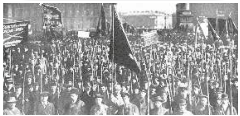
సోవియట్ రెడ్ గార్డ్స్

“భూమి, శాంతి, రొట్టె’ నినాదంతో బోల్షివిక్లు ప్రజలను కదిలించారు. ‘అల్ రష్యన్, కాంగ్రెస్ ఆఫ్ సోవియట్స్ ఆఫ్ వర్కర్స్, సోల్జర్స్, అండ్ పెజెంట్స్ డిప్యూటీస్’ (రష్యాలోని కార్మికుల, సైనికుల, రైతుల, సోవియట్ ప్రతినిధుల సమాఖ్య) భూమికి, శాంతికి సంబంధించిన మొట్టమొదటి ప్రకటన చేయడం ఈ కొత్త ప్రభుత్వం వేసిన తొట్ట తొలి అడుగు.”