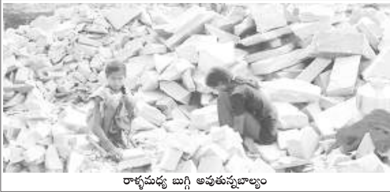
రాళ్ళమధ్య బుగ్గి అవుతున్నబాల్యం

“విషయమేమంటే ఫ్యాక్టరీల చట్టం అనేది పెద్దదైన కార్మికుల కోసం, అలాగే నియంత్రణా వ్యవస్థ అనేది యువజనులు, పెద్దలకు మాత్రమే వర్తిస్తుంది తప్ప, బాల కార్మికులకు ఏ రకంగానూ వర్తించదు. బాలలను ఒక ప్రత్యేక గ్రూపుగా పరిగణించి అభివృద్ధి, రక్షణకు మరింత స్పష్టమైన చర్యల అవసరాన్ని గుర్తించడంలో శాసన నిర్మాతలు విఫలమయ్యారు.”