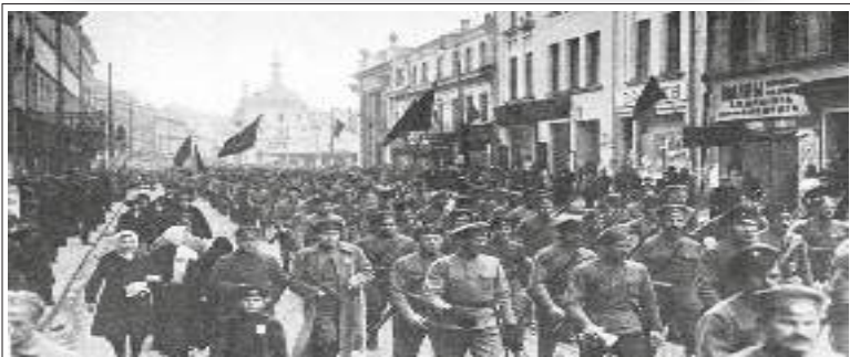
అక్టోబర్ విప్లవంలో పాల్గొంటున్న ప్రజలు

“ఇరవైయవ శతాబ్దంలోని అత్యంత దుర్మార్గమైన ఫాసిజం అంతం కావడానికి సోవియట్ యూనియన్, అది చేసిన పోరాటాలే ముఖ్య కారణం. ఫాసిజానికి వ్యతిరేకంగా జరిగిన ఈ ప్రజాయుద్ధంలో రెండు కోట్లకు పైగా సోవియట్ ప్రజలు తమ ప్రాణాలను బలిఇచ్చారు. నాజీ యుద్ధ వ్యూహాన్ని ఛిద్రం చేసింది ఎర్రసైన్యమే.”