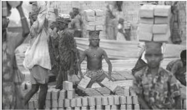
భవన నిర్మాణాలలోయ బాలకార్మికులు

“దీనికి అదనంగా, చట్టబద్ధంగా లభించిన ఈ అవకాశాన్ని కాంట్రాక్టర్లు దుర్వినియోగపరుస్తూ బాల కార్మికులను పొరుగు సేవలకు, తేలిక పనుల్లో కుటుంబ సభ్యుల్లో పెద్దవారికి సహాయకులుగా ఉపయోగిస్తున్నారు. ఆ విధంగా వనిలో ఎక్కువ భాగాన్ని పిల్లలకు మళ్ళించడానికి, తక్కువ వేతనాలు ఇవ్వడానికి, దోపిడీ చేయడానికి కాంట్రాక్టర్లకు మంచి అవకాశాన్ని కల్పిస్తుంది.”