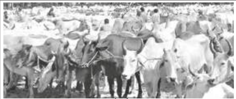
హిందుత్వవాదుల చేతిలో ఆయుధం ఆవు

“అశోకునికి మానవుల, జంతువుల ప్రాణాల యొక్క పవిత్రత పట్ల శ్రద్ధ ఉన్నది. అవసరం లేనిచోట ప్రాణాలను తీయడాన్ని అడ్డుకోవడమే తన విధిగా అశోకుడు భావిస్తాడు. అందుకే ఆయన జంతు బలులను నిషేధించాడు. బలులను ఆయన అనవసరమైన చర్యగా భావిస్తాడు. ఉపయోగించబడని, తినబడని జంతువుల బలులను కూడా అనవసర చర్యగా భావించాడు.”