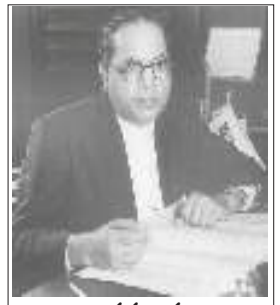
రచయిత భారత రాజ్యాంగ నిర్మాత

కొన్ని కులాలకు చెందినవారు తీసుకునే ఆహారంలో చనిపోయిన ఆవు మాంసం ప్రధానమైనదిగా 1910లో జనాభా లెక్కల నివేదికలో చెప్పబడింది. వారే సహజంగా అంటరాని కులాలకు చెందినవారుగా విభజింపబడినారు. హిందూమతంలోని క్రింది కులాలకు చెందినవారు కూడ గోమాంసాన్ని ముఖ్యకాదు. ఇంకొకవైపు అసలు అంటరాని కులం అనేది ఒకటి లేనేలేదు. దానికి గోమాంసానికి ఏ సంబంధం లేదు. కొంతమంది గోమాంసాన్ని తింటారు. కొందరు ఆవు చర్మాన్ని పలుస్తారు. మరికొందరు గో చర్మం, ఎముకల నుండి కొన్ని వస్తువులు తయారుచేస్తారు.