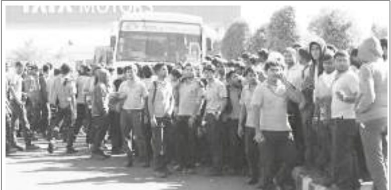
కనీస హక్కులకోసం సమ్మె చేస్తున్న టాటా మోటార్స్ కార్మికులు

“2005 సవరణ ద్వారా 46 లక్షల హెక్టార్లకు పైగా ప్రభుత్వ నియంత్రణలో ఉన్న బంజరు భూములను పరిశ్రమలు పెట్టేందుకు, కార్పొరేట్ వ్యవసాయాన్ని ప్రవేశపెట్టేందుకు బడా పారిశ్రామిక సంస్థలకు బదిలీ చేశారు. సాగు చేసేందుకు వీలుండే బంజరు భూములు ఎక్కడున్నా కార్పొరేట్ సాగు కోసం కట్టబెట్టేశారు.”