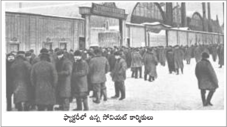
ఫ్యాక్టరీలో ఉన్న సోవియట్ కార్మికులు

“వాణిజ్య లావాదేవీలూ, కాంట్రాక్టులు వగైరాలను “పవిత్ర ఆస్తిహక్కును కాపాడే” వర్తక రహస్యాల చాటున మరుగుపరుస్తుంది. సోవియట్ ప్రభుత్వం వర్తక రహస్యాలను రద్దుచేసిందిగానీ, ఆర్థిక పోటీని ప్రోత్సహించేందుకు పబ్లిసిటీని వినియోగించడానికీ ఏమీ చెయ్యలేదని ఆయన అంగీకరించాడు. 99