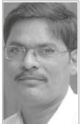
రచయిత సీఐబి(ఎం) కేంద్రకమిటీ సభ్యులు

సమిష్టి నిర్ణయాలు, వ్యక్తిగత బాధ్యత, తనిఖీల మధ్య పరస్పర సంబంధం ఉన్నది. ఈ మూడు అంశాల నమన్వయంతో పనిచేసినప్పుడే సరైన ఫలితాలు సాధించగలము. నిర్ణయాలు ఎప్పుడూ సమిష్టిగానే చేయాలి. అమలు జరిపే బాధ్యత మాత్రం వ్యక్తులదే. నిర్ణయించిన కర్తవ్యం అమలు కోసం ఎవరెవరు ఏ బాధ్యతలు తీసుకోవాలి? కూడా సమిష్టిగానే నిర్ణయించాలి. ఒకసారి నిర్ణయం జరిగిన తర్వాత ఎవరికీ అప్పగించిన పనిలో వారు నిమగ్నమై ఉండాలి. తమకు అప్పగించిన బాధ్యత సమర్థ వంతంగా నిర్వహించేందుకు సర్దుశక్తులు ఒడ్డి పనిచేయాలి. అందుకవసరమైన సహకారం తీసుకోవలసిన బాధ్యత వారిదే. అదే సమయంలో నాయకత్వం తనిఖీ, అవసరమైన సహాయం కూడా చాలా కీలక పాత్ర పోషిస్తుంది.