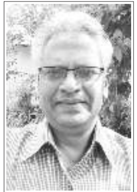
రచయిత లెనిన్ జీవిత చరిత్ర పరిశోధకులు

ఒక పెట్టుబడిదారీ దేశంలో సోషలిస్టు విప్లవం విజయం సాధించాక, ఆ దేశ ప్రభుత్వం వెంటనే ఏ కర్తవ్యాల్ని నిర్వహించాలి? ఈ ప్రశ్నకు సమాధానం లెనిన్ రాసిన “సోవియట్ ప్రభుత్వ తక్షణ కర్తవ్యాలు” అనే సుప్రసిద్ధ వ్యాసం నుండి మనకు లభిస్తుంది.