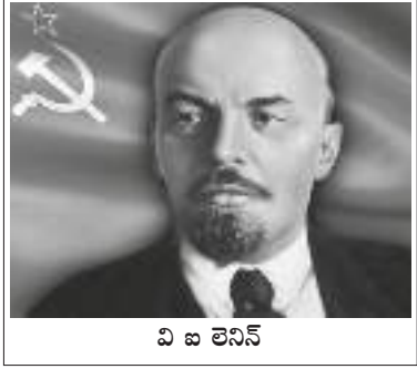
వి ఐ లెనిన్

మరోవైపున పెట్టుబడిదారీ వ్యవస్థ నుండి సోషలిజానికి జరిగే ప్రతి పరివర్తనలోనూ రెండు కారణాల వల్ల, రెండు ప్రధాన మార్గాలలో నియంతృత్వం అవసరమవుతుంది. మొదటిది, పెట్టుబడిదార్ల సంపదా, వారి సౌకర్యాల వెంటనే తొలగించబడును కాబట్టి, చాలాకాలం పాటు వాళ్ళు బీదల పాలనను కూలదోయడానికి ప్రయ