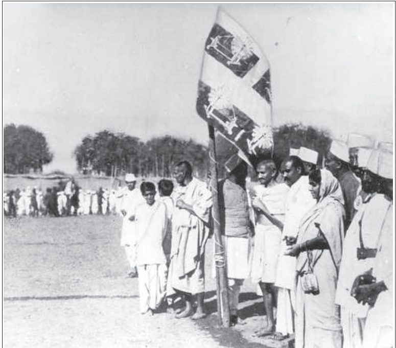
1921 డిసెంబర్లో జరిగిన అహ్మదాబాద్ సమావేశంలో పతాకావిష్కరణ సందర్భంగా గాంధీజీ, పటేల్, సరోజినీ నాయుడు తదితరులు

“ కొత్తగా అభివృద్ధి చెందిన పరిశ్రమలు వేలాది కార్మికులను రద్దీ నగరాలకు తరలించాయి. అంతిమంగా వారిలో తిరుగుబాటును అనివార్యం చేశాయి. వ్యాపారులు, పారిశ్రామిక వేత్తల సంపదల అకస్మికాభివృద్ధి, కార్మికుల పేదరికాన్ని, కడగండ్లను పెంచేసింది. నగర జీవితం కార్మికుల్లో నూతన చైతన్యాన్ని నింపింది. ఇప్పటి వరకూ బ్రిటీష్ పాలనతో నెలకొన్న దయనీయ పరిస్థితులకు స్పష్టి చెప్పాలని వారు సంకల్పించారు. ”