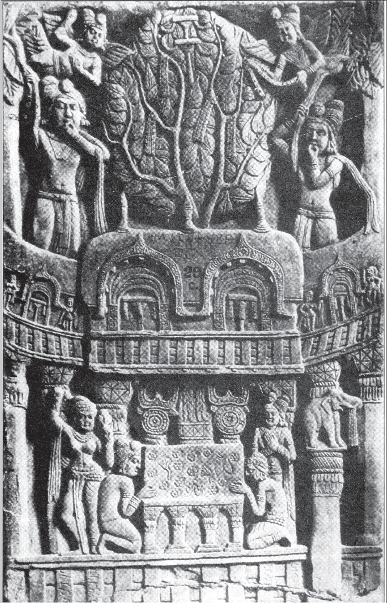
బోధి వృక్షం కింద శాశ్వత ముని (గౌతమ బుద్ధుడు) జ్ఞానోదయాన్ని వివరిస్తూ క్రీ.పూ రెండవ శతాబ్దంలో చెక్కిన శిల్పం

“ బుద్ధుడు ప్రపంచంలో ఆనందం అనేది లేదని ఎక్కడా చెప్పలేదు. జీవితంలో ఏదోఒక రూపంలో దుఃఖం వెంటాడుతుందని చెప్పాడు. “సముద్రానిది ఒకటే రుచి. ఉప్పుగా ఉంటుంది. అదే విధంగా నా సిద్ధాంతానిది ఒకటే రుచి. బాధలనుండి విముక్తి ఏ విధంగా కలుగుతుందో వివరించడం.” ”