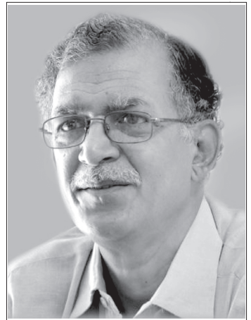
రచయిత ప్రజాశక్తి సంపాదకులు

“బుద్ధం శరణం గచ్ఛామి ధమ్మం శరణం గచ్ఛామి సంఘం శరణం గచ్ఛామి”