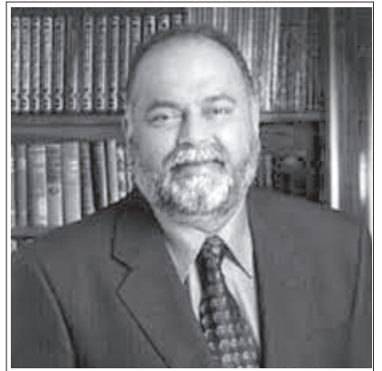
రచయిత న్యూయార్క్, బెర్లిన్ యూనివర్సిటీల్లో ప్రొఫెసర్